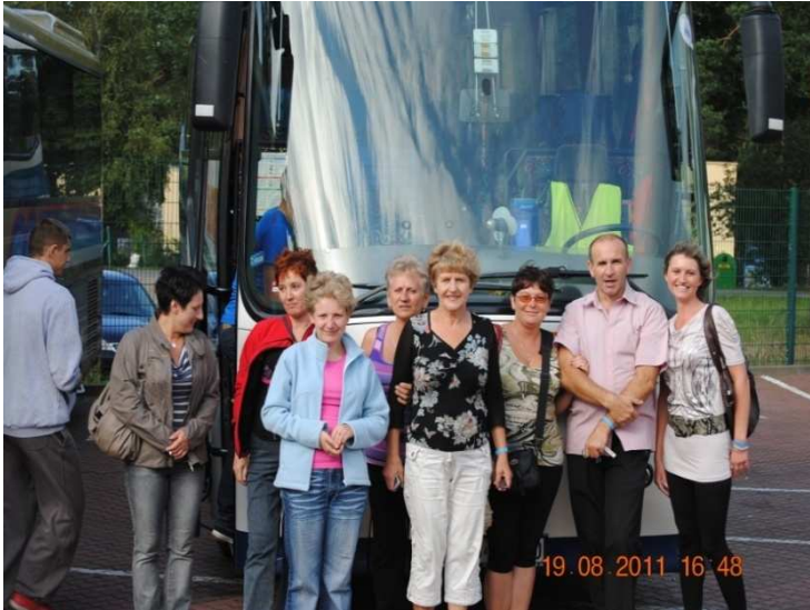
Turnus rehabilitacyjny, powrót do domu, Jarosławiec, 2011 r.