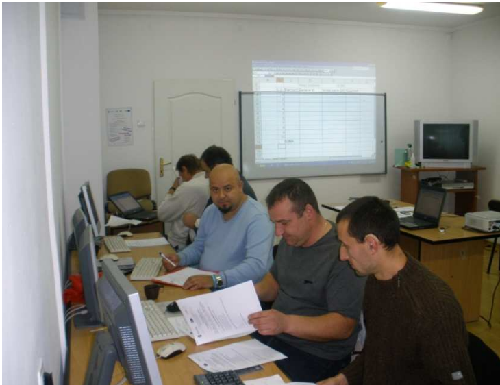
Kurs komputerowy dla początkujących, Parczew 2011r.