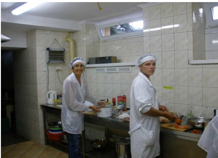
Kurs gotowania dla zaawansowanych, Parczew 2011r.

Projekt systemowy w ramach Priorytetu VII "Promocja integracji społecznej" Działanie 7.1. Rozwój i upowszechnienie aktywnej integracji Poddziałanie 7.1.2.