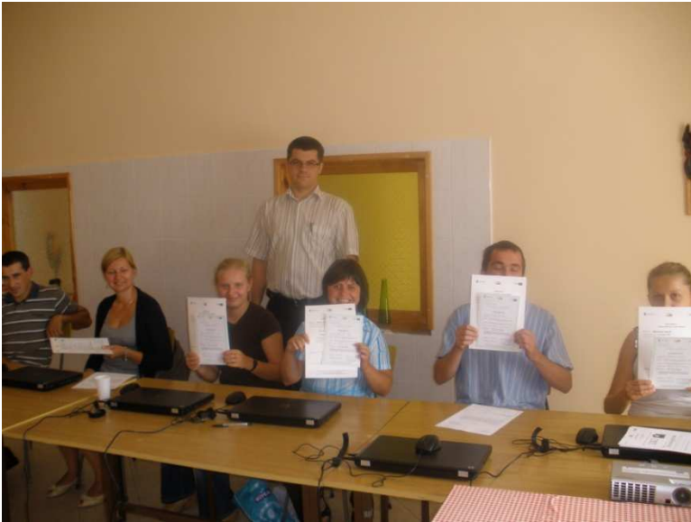
Kurs komputerowy dla początkujących, Parczew 2010 r.