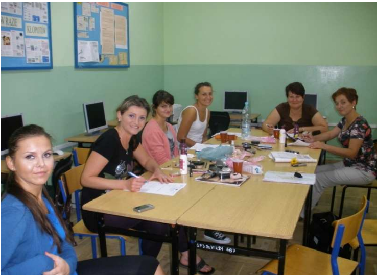
Kurs wizażu i stylizacji, Parczew 2011 r.

Projekt systemowy w ramach Priorytetu VII "Promocja integracji społecznej" Działanie 7.1. Rozwój i upowszechnienie aktywnej integracji Poddziałanie 7.1.2.