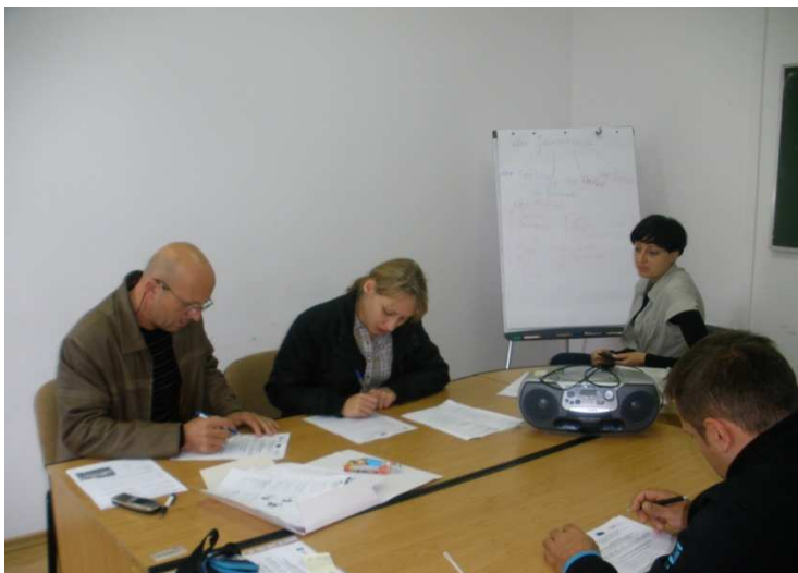
Kurs języka niemieckiego, Parczew 2011r.

Projekt systemowy w ramach Priorytetu VII "Promocja integracji społecznej" Działanie 7.1. Rozwój i upowszechnienie aktywnej integracji Poddziałanie 7.1.2. Rozwój i upowszechnienie aktywnej integracji przez powiatowe centra pomocy rodzinie współfinansowany ze środków Unii Europejskiej w ramach Europejskiego Funduszu Społecznego