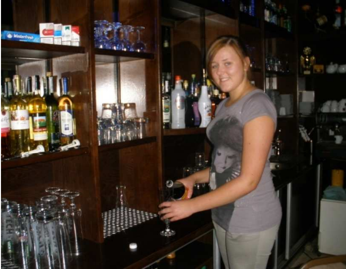
Kurs barman - kelner, Parczew 2011 r.