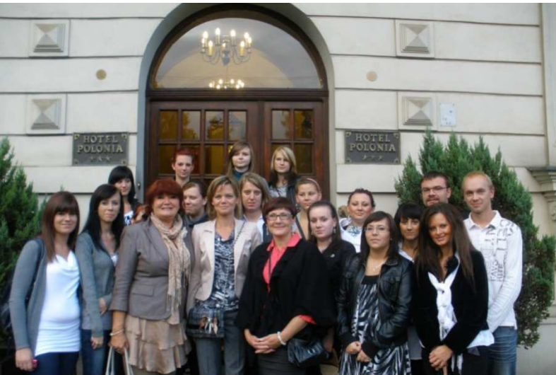
Wycieczka integracyjna, Kraków 2011 r.

Projekt systemowy w ramach Priorytetu VII "Promocja integracji społecznej" Działanie 7.1. Rozwój i upowszechnienie aktywnej integracji Poddziałanie 7.1.2. Rozwój i upowszechnienie aktywnej integracji przez powiatowe centra pomocy rodzinie współfinansowany ze środków Unii Europejskiej w ramach Europejskiego Funduszu Społecznego