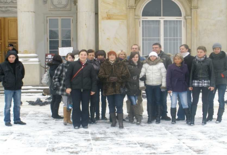
Wycieczka integracyjna, Warszawa 2010 r.