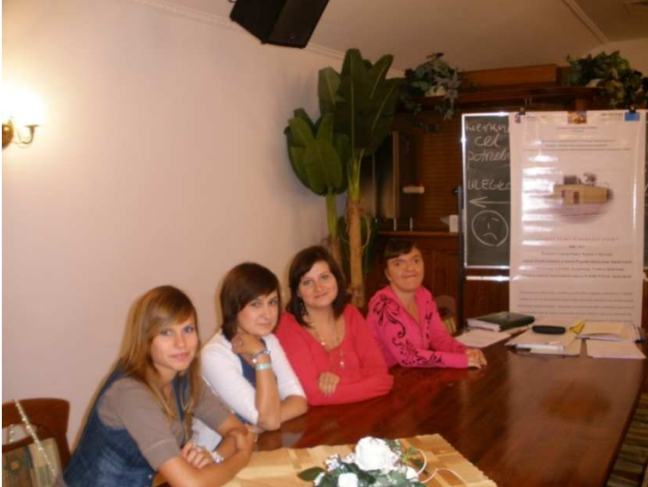
Turnus rehabilitacyjny - warsztaty psychologiczne, Jarosławiec, 2010r.